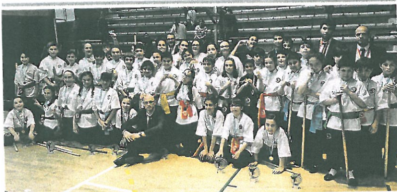
CAMPEONATO ESCOLAR EN PORRIÑO

La UD A Estrada organiza este fin de semana la primera edición del Torneo de Verán de fútbol sala. Tendrá lugar hoy y mañana en el pabellón Coto Ferreiro con la participación de más de treinta equipos entre las distintas categorías. Arrancará a las 9.00 horas de hoy para terminar el domingo sobre las 21.00 horas. Habrá además sorteo de una televisión y rifas con regalo directo.