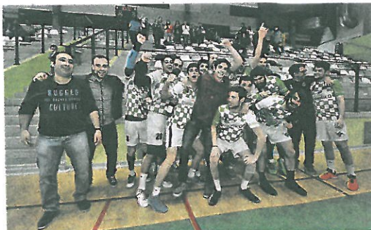
Los dezanos celebrando el ascenso a Primera Autonómica.

Pincho avanzó su intención de que contar con jugadores dispuestos a entrenar tres días semanales. Esta temporada recién concluida la plantilla se confeccionó a última hora y hubo que aceptar la petición de algunos integrantes de no entrenar todos los días por distintos moti-