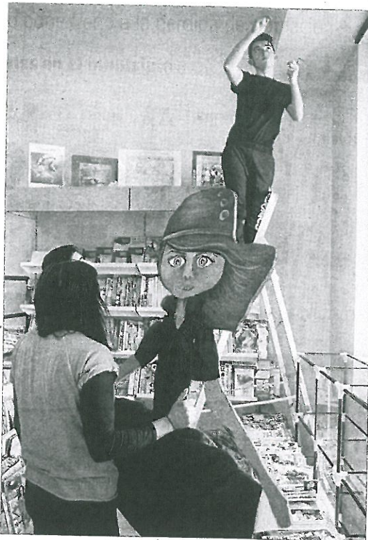
Prácticas de escaparatismo de alumnos de un ciclo de comercio del IES Pintor Colmeiro en una librería de Silleda.

El IES Plurilingüe Pintor Colmeiro mantiene sus otros tres ciclos: El más demandado es el Ciclo Medio de Conducción de actividades físico-deportivas en el medio natural, que no solo suele cubrir las 22 plazas —a las que se suman los repetidores, de modo que en el último curso fueron 23 los estudiantes de 1º—, sino que incluso registra lista de espera; aunque son dos cursos, en realidad toda la formación se realiza en un año y tres meses. También registra una notable demanda el Ciclo Superior de Gestión de ventas y espacios comerciales, que venía a ser una continuidad del ahora suprimido; en cada curso suele haber de 12 a 15 alumnos, de modo que se superan con creces los ocho solicitantes mínimos que establece la consellería para la apertura automática de matrícula. Completa la oferta el Ciclo de Formación Profesional Básica de Servicios comerciales, con una media de 7 u 8 matriculados en sus dos cursos.