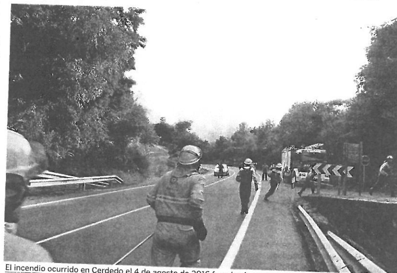
El incendio ocurrido en Cerdedo el 4 de agosto de 2016 fue el más grande de España ese año.

Empecemos de atrás hacia adelante. La última década se empezó de la peor de las maneras. El año 2006 fue especialmente dramático en cuanto a fuegos. Afortunadamente, no hay ningún otro ejercicio que se le acerque ni de lejos. En aquel año ardieron casi 41.000 hectáreas. Hubo en la provincia de Pontevedra un total de 361 fuegos y 1.437 conatos. De ellos, 21 superaron